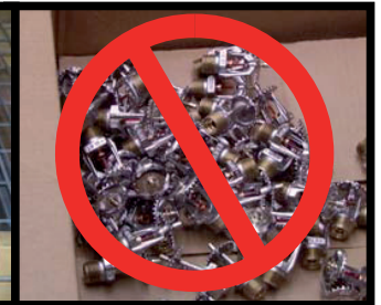
NON CORRETTO! (Sprinkler sfusi)