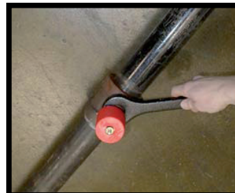
CORRETTO (Tubazione installata al soffitto)