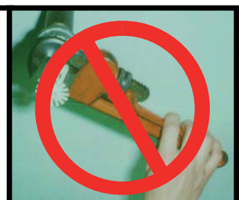
NON CORRETTO! (Chiave specifica non utilizzata)

ATTENZIONE: Gli sprinkler che hanno perdite di liquido dal bulbo oppure hanno il diffusore danneggiato devono essere eliminati. Non installare sprinkler che sono caduti, che sono stati danneggiati o che sono stati esposti a temperature superiori a quella consentita. Secondo NFPA13, gli sprinkler che sono stati erroneamente verniciati devono essere sostituiti. Proteggere gli sprinkler durante le fasi verniciatura, non usare solventi sugli sprinkler. Fare riferimento alle specifiche riportate sulle schede tecniche relative allo sprinkler che state utilizzando, altre informazioni sono disponibili sul sito internet www.vikinggroupinc.com .