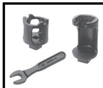
CORRETTO (Chiavi speciali per l'installazione)