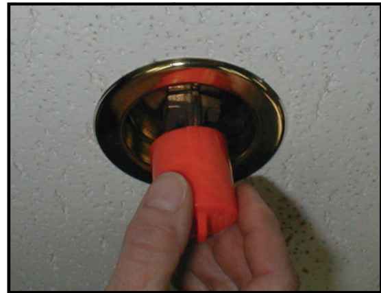
Figura 2: Rimozione di un cappuccio di protezione da uno sprinkler in basso