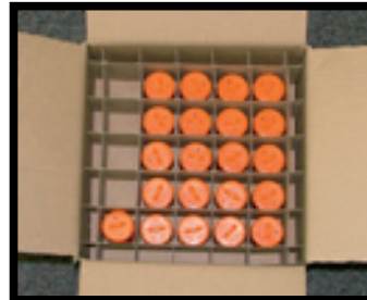
CORRETTO (Sprinkler protetti dal coperchio)