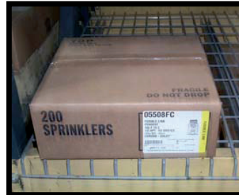
CORRETTO (Sprinkler nelle confezioni originali)