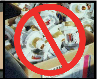
NON CORRETTO! (Coperchi di protezione non usati)