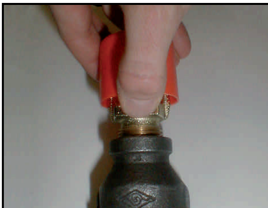
Figura 3: Rimozione di un cappuccio di protezione da uno sprinkler in alto