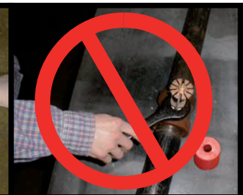
NON CORRETTO! (Sprinkler su tubo a terra)