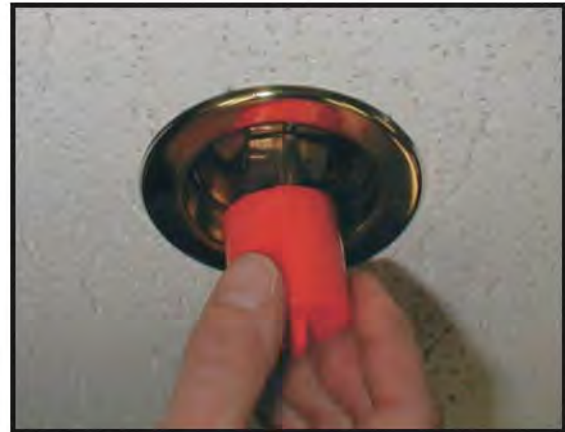
Figure 2 : Enlèvement du capuchon d'un sprinkleur pendant.