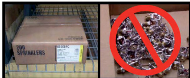
CORRECT (Emballage d'origine utilisé) INCORRECT (Sprinkleurs stockés en vrac)