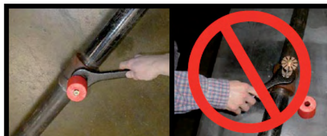
CORRECT (Tuyauterie en place au plafond) INCORRECT (Sprinkleur monté au sol)