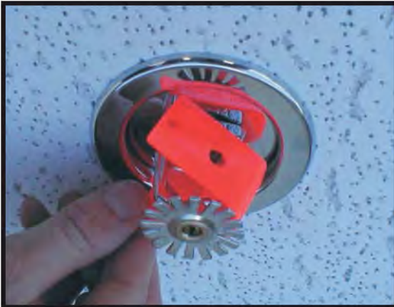
Figure 1 : Enlèvement du clip d'un sprinkleur pendant.