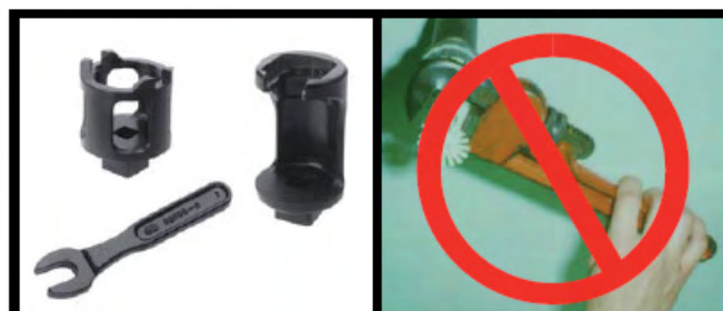
CORRECT (Clés spéciales) INCORRECT (Clé spéciale non utilisée)

AVERTISSEMENT : Tout sprinkleur présentant une perte de liquide de son ampoule ou un mécanisme de déclenchement abîmé devrait être détruit immédiatement. Ne jamais installer des sprinkleurs qui sont tombés ou qui ont été endommagés d'une quelconque manière ni des sprinkleurs qui ont été exposés à des températures dépassant la température ambiante maximum permise. Selon la norme NFPA 13, il faut remplacer les sprinkleurs qui ont été peints sur site. Protéger les sprinkleurs de toute peinture conformément aux normes d'installation. Ne pas nettoyer des sprinkleurs au savon et à l'eau, à l'ammoniaque ou à l'aide de tout autre liquide nettoyant. Ne pas utiliser des adhésifs ou des solvants sur des sprinkleurs ou sur leurs mécanismes de déclenchement.