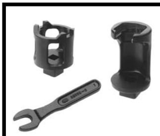
JUIST (speciale montagesleutels)