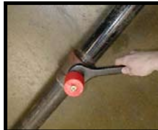
JUIST (leidingwerk zit op zijn plaats tegen het plafond)