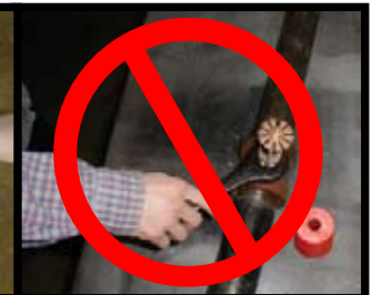
ONJUIST! (sprinkler op grondniveau)