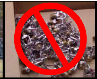
ONJUIST! (sprinklers los in doos)