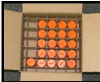
JUIST (sprinklers beschermd met kappen)