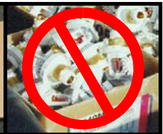
ONJUIST! (beschermkappen niet gebruikt)