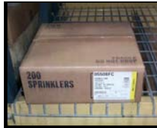
JUIST (originele doos gebruikt)